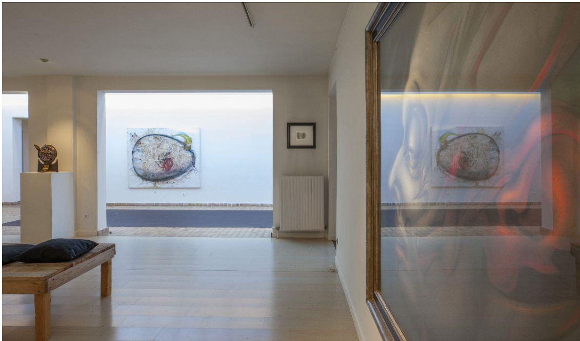
Octave Landuyt, Koen Vanmechelen

Als schilder lijkt hij één van de laatste Vlaamse primitieven te zijn. De manier waarop hij geduldig en op groot formaat schilderijen weet te creëren is zo uniek, dat musea en Biënnales hem wereldwijd uitnodigen. De fijnbesnaarde penseelvoering, waarin diepte, kleur en kennis samenvallen, hebben al jaren verzamelaars, musea maar ook nieuwe kunstenaars geïnspireerd. Maar ook als juweelontwerper weet Landuyt zich vanaf de jaren '60 te onderscheiden als dé pionier van het kunstenaarsjuweel, met heel eigen en originele stijl, waarmee hij een ongelooflijke collectie van unieke stukken in goud, zilver en edelstenen bij elkaar smeedt. Als beeldhouwer wist hij de limieten van het bronsgieten op te zoeken, vanuit de klei die hij als klein kind als door zijn vingers voelde gaan. Daarnaast wist hij met samenwerkingen met experts in hun veld, bedrijven en ontwerpers, ook een oeuvre uit te bouwen in textiel, meubels waarbij hij zijn eigen stijl wist te verbinden met nieuwe technologieën en innovaties van het moment.